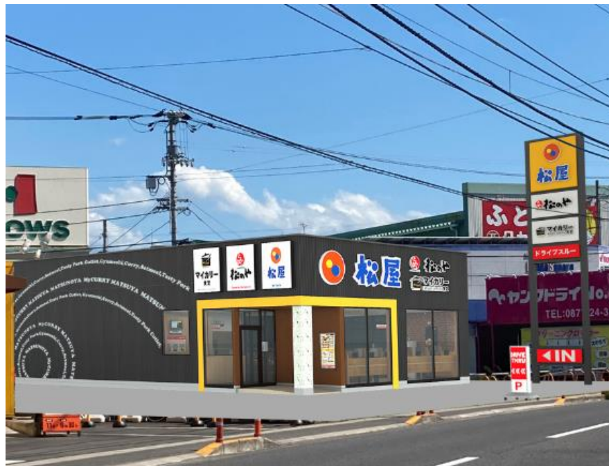
R丸亀中府店 (松屋+松のや+マイカー食堂の複合店舗) 2023年3月15日OPEN