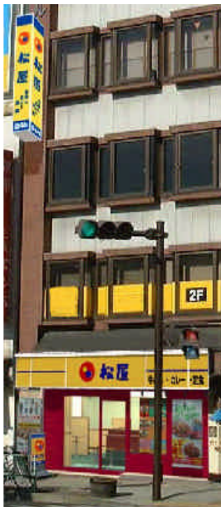
松本駅前店外観イメージ図

地域のお客様に快適な店舗でライフスタイルに合わせ、朝食、昼食、夕食、夜食にさまざまな味を楽しんでいただけるよう豚めし、ヘルシーチキンカレーをはじめ各種定食メニュー（ハンバーグなど）をご提供申し上げます。年齢性別を問わず幅広いお客様に気軽にご利用いただけるお店です。